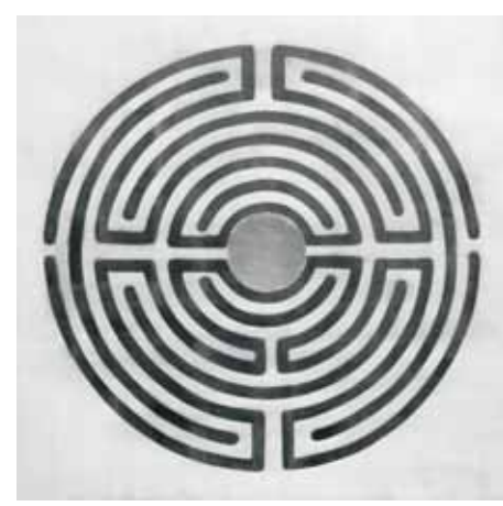
Labirint sretnog susreta 2, 2023., akril i zlatni listići na platnu, 80 x 80 cm, V i IR (Z)

Dijana Nazor Čorda rođena je 1971. u Splitu. Doktorirala je na poslijediplomskom sveučilišnom doktorskom studiju Slikarstvo na Akademiji likovnih umjetnosti Sveučilišta u Zagrebu 2017. s temom Slike u infracrvenom području: odlaganje vidljivoga . Diplomirala je 1995. godine na Fakultetu prirodoslovno-matematičkih znanosti i odgojnih područja u Splitu, danas Umjetnička akademija, program studija Likovna kultura te stekla zvanje profesora likovne kulture-restauratora. Iste godine dobiva nagradu fakulteta. Godine 1990. maturirala je u Školskom centru za primijenjenu umjetnost i dizajn u Splitu. Od 1995. izlagala je na 44 samostalne izložbe u Hrvatskoj, Belgiji i Australiji. Od 1993. sudjelovala je na preko 100 žiriranih skupnih izložbi u zemlji i inozemstvu. Njezine se slike nalaze u fundusima više hrvatskih muzeja i privatnih zbirki. Sudjelovala je na 42 likovne kolonije u Hrvatskoj i Bosni i Hercegovini. Dobitnica je više nagrada, priznanja i pohvala za umjetnički rad. Za doprinos u likovno-pedagoškom radu dodijeljene su joj dvije državne nagrade: Godišnja državna Nagrada Ivan Filipović 2012. i odlikovanje Red Danice hrvatske s likom Antuna Radića 2013. Članica je HDLU-a Zagreb, InSEA-e., HGZD-a, HULULK-a i Grupe Infra. Živi i radi u Zagrebu.