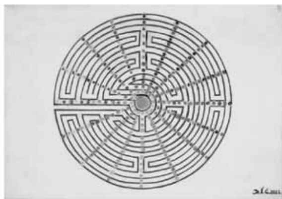
Tajni labirint, 2022., akril i zlatni listići na platnu, 50 x 69,5 cm, V i IR(Z)