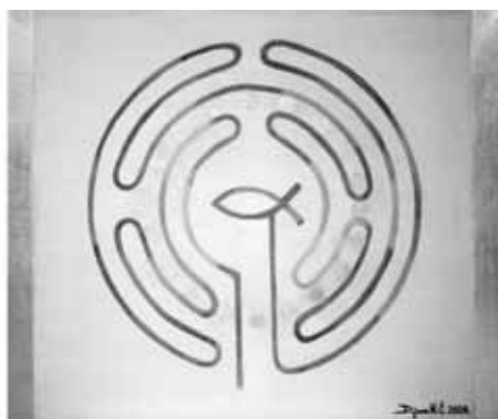
Tajanstveni krug 3, 2020., akril i zlatni listići na platnu, 50 x 60 cm, V i IR (Z)