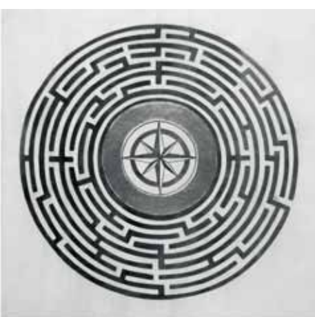
Labirint sretnog susreta 1, 2023., akril i zlatni listići na platnu, 80 x 80 cm, V i IR (Z)